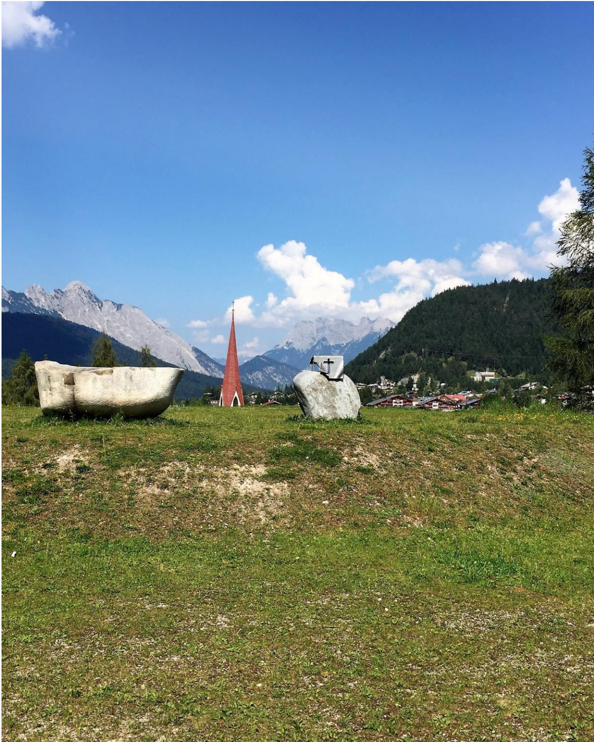
Openluchtaltaar op de Pfarrhügel in Seefeld, Oostenrijk

Informatieblad van de oud-katholieke parochie van Amersfoort